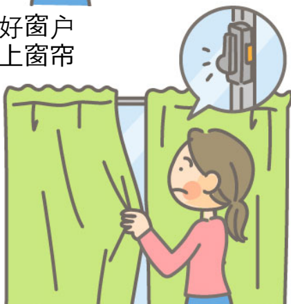
③ 锁好窗户 拉上窗帘